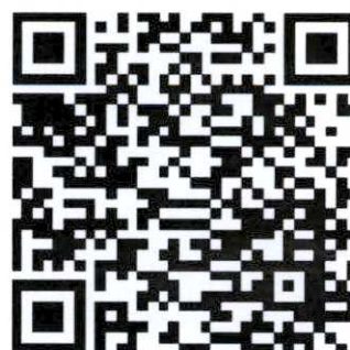
QR-Cord (ข้อมูลการไกล่เกลี่ย)